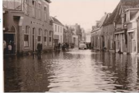
Zie jij wat er niet klopt aan deze oude foto van Eibergen? Heel goed kijken!

Alle kinderen en jongeren, van 8-15 jaar, zijn van harte welkom op donderdag 31 oktober om 10.00 uur. En... ook ouders en grootouders mogen meedoen. Een gezellige activiteit in de herfstvakantie dus. Helemaal gratis, maar aanmelden is wel nodig: www.oostachterhoek.nl/nepnieuws .